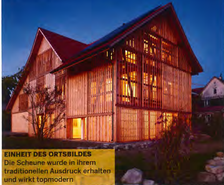
EINHEIT DES ORTSBILDES Die Scheune wurde in ihrem traditionellen Ausdruck erhalten und wirkt topmodern